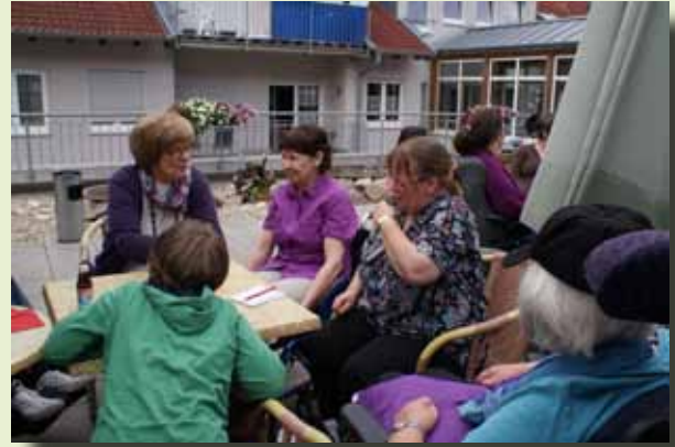
Viel Spaß hatten die Bewohner der Jungen Pflege beim Erdbeerfest auf der Terasse.