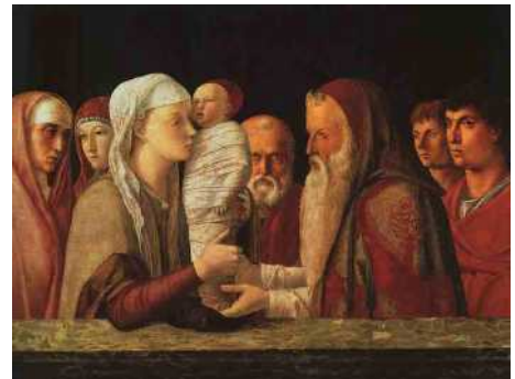
Giovanni Bellini, um 1459, Galleria Querini Stampalia in Venedig

DAS FEST DER "DARSTELLUNG DES HERRN" WIRD VIERZIG TAGE NACH WEIHNACHTEN ALS ABSCHLUSS DER WEIHNACHTLICHEN FESTE GEFEIERT. DER FRÜHER GEBRÄUCHLICHE NAME "MARIÄ REINIGUNG" ERINNERT AN DEN JÜDISCHEN BRAUCH, AUF DEN SICH DAS FEST BEZIEHT: NACH DEN VORSCHRIFTEN DES ALTEN TESTAMENTS GALT DIE MUTTER VIERZIG TAGE NACH DER GEBURT EINES SOHNES ALS UNREIN. DIE FRAU MUSSTE EIN REINIGUNGSOFFER DARBRINGEN, WAHLWEISE EINE ODER ZWEI TAUBEN ODER IN BESONDERS GRAVIERENDEN FÄLLEN EIN SCHAF. MARIA PILGERTE ALSO ZU DIESER IHRER "REINIGUNG" IN DEN TEMPEL. DA AUSSERDEM JESUS DER ERSTE SOHN WAR, GALT ER ALS EIGENTUM GOTTES UND MUSSTE VON DEN ELTERN ZUERST AUSGELÖST WERDEN: ER WURDE ER ZUM PRIESTER GEBRACHT UND VOR GOTT "DARGESTELLT". ALS DIE ELTERN ZU DIESEM ZWECK IN DEN TEMPEL KAMEN, BEGEGNETEN SIE DEM BETAGTEN SIMEON UND DER PROPHETIN HANNAH, DIE ERKANNTEN, DASS JESUS KEIN GEWÖHNLICHES KIND IST UND IHN ALS DEN ERLÖSER ISRAELS PRIESEN (LUKASEVANGELIUM 2, 21 - 40).